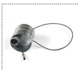
valvola "fuoco aperto"