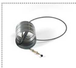
valvola de chiusura esterna