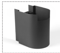
Copertura collegamento aria esterna